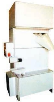
Cámara de volteo: