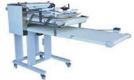
Formadora de barras: