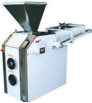
Pesadora Heñidora (teja):